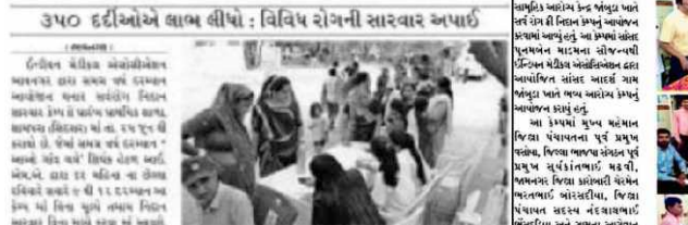
આઈ.એમ.એ. દ્વારા શામપરા ખાતે સર્વરોગ નિદાન સારવાર કેમ્પ સંપન્ન. આ કાર્યક્રમમાં સર્વરોગ નિદાન સારવાર કેમ્પ સંપન્ન.