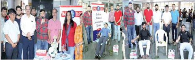
આજકાલ પ્રવૃત્તિઓ કરીને આ ડોનેશન કેમ્પને આગળ વધારવામાં આવે છે. ડોક્ટર્સ અને તેમના પરિવારજનોએ આ કાર્યક્રમમાં સક્રિય ભૂમિકા ભજવી છે.

ઈન્ડિયન મેડિકલ એસોસિએશન રાજકોટ બ્રાન્ચએ અત્યાર સુધીમાં રેકોર્ડ બ્રેક રક્તદાન કેમ્પ કરી સમગ્ર દેશમાં મોખરે જરૂરિયાતમંદ અને શેડેરોનિક દર્દીઓને નિયમિત રીતે બ્લડ મળી રહે તે માટે ૧૫ વર્ષથી ડોક્ટરો દ્વારા આયોજિત બ્લડ ડોનેશન કેમ્પમાં ડોક્ટરો અને તેમના પરિવારજનો રક્તદાન કરે છે