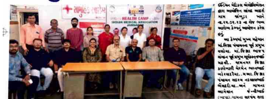
જામનગર તાલુકાના જાંબુડા ખાતે આરોગ્ય નિ:શુલ્ક સર્વરોગ નિદાન કેમ્પ યોજાયા. આ કાર્યક્રમમાં સર્વરોગ નિદાન સારવાર કેમ્પ સંપન્ન.