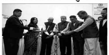
વરિષ્ઠ તબીબોને પુરસ્કારથી આલ. અમદાવાદ મેડિકલ સન્માનિત કરવામાં આવેલ. એસોસિએશન દ્વારા અંગદાન મેડીકલની વિવિધ શેઝની પરીક્ષામાં સર્વોચ્ચ સ્થાન પ્રાપ્ત કરનાર વિદ્યાર્થીઓનું પણ સન્માન કરવામાં

અમદાવાદ મેડિકલ એસોસિએશન દ્વારા ૧૬/૦૭/૨૦૨૩ ના રોજ ૧૨૧મો વાર્ષિક દિવસની ઉજવણીનું આયોજન કરવામાં આવ્યું હતું. આ પ્રસંગે ડા.૫.૬૬૬ લાઈફ સમય-સંસ્થા અધ્યક્ષ પંકજ પટેલ મુખ્ય મહેમાન હતા અને નેશનલ કોરોનેલિક સાયન્સ યુનિવર્સિટીના વાઈસ ચાન્સેલર પદમશ્રી ડો. જી.એમ. વ્યાસ અધિકારિ વિશેષ તરીકે ઉપસ્થિત રહેલ. સમાજના કલ્યાણ અને આરોગ્યની સુધાકારી તેમજ તબીબી શિક્ષણ જેને શ્રેષ્ઠ યોગદાન માટે યથા