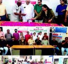
જાંબુડા ખાતે સર્વ રોગ ફ્રી નિદાન કેમ્પ યોજાયા. આ કાર્યક્રમમાં સર્વરોગ નિદાન સારવાર કેમ્પ સંપન્ન.