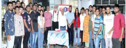
નવનિયુક્ત ટીમના ૧૫ સભ્યોની સીટીંગ ફોટો. આ ડોનેશન કેમ્પને આગળ વધારવામાં આવે છે.

આજે પહેલી જુલાઈએ ડોક્ટર્સ ડે, લાઇફવોરિયર્સથી કોરોના વોરિયર્સ ડોક્ટરોને સલામ દઈઓ અને ડોક્ટરોની દિલ એ દાર્તાન લોહીના સંબંધ વિના રક્ત વહાવી બન્યા જીવનદાતા. ઈન્ડિયન મેડિકલ એસોસિએશન રાજકોટ બ્રાન્ચએ અત્યાર સુધીમાં રેકોર્ડ બ્રેક રક્તદાન કેમ્પ કરી સમગ્ર દેશમાં મોખરે જરૂરિયાતમંદ અને શેડેરોનિક દર્દીઓને નિયમિત રીતે બ્લડ મળી રહે તે માટે ૧૫ વર્ષથી ડોક્ટરો દ્વારા આયોજિત બ્લડ ડોનેશન કેમ્પમાં ડોક્ટરો અને તેમના પરિવારજનો રક્તદાન કરે છે.