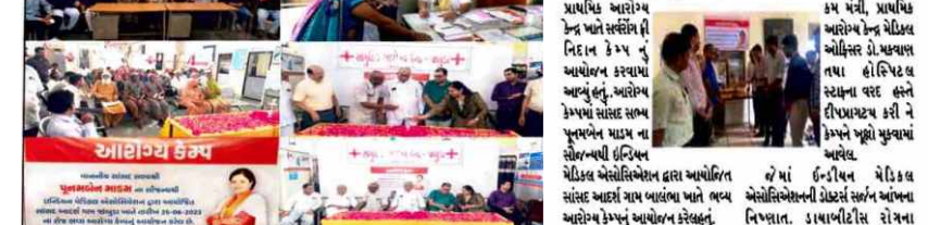
જોડીયા તાલુકાના બાલંબા પ્રા. આ. કેન્દ્ર ખાતે સર્વ રોગ ફ્રી નિદાન કેમ્પ યોજાયા. આ કાર્યક્રમમાં સર્વરોગ નિદાન સારવાર કેમ્પ સંપન્ન.