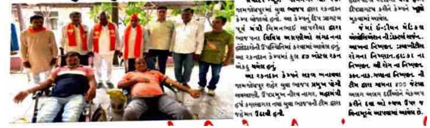
જામજોધપુરમાં યુવા ભાજપ દ્વારા રક્તદાન કેમ્પ યોજાયા. આ કાર્યક્રમમાં સર્વરોગ નિદાન સારવાર કેમ્પ સંપન્ન.