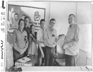
લોકસભામાં પસાર થયેલા ત્રણ વિધેયો સામે કલોલા મેડિકલ એસોસિએશનના સભ્યોએ પણ વિરોધ દર્શાવી ધારસભ્યને આવેદન આપ્યું હતું.