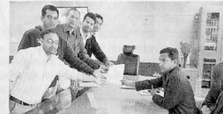
બોટાદ જિલ્લા કલેક્ટરને આવેદન આપતા તબીબો. તસ્વીર-ગોંગાવડાઓ

ઈન્ડિયન મેડિકલ એસોસિએશન બોટાદ દ્વારા સરકારે સુચવેલા એનએમસી બિલ-2017, એમસીએ બિલ-2018 અને ગ્રાહક સુરક્ષા બિલ-2018નો વિરોધ કરી કાળી પટ્ટી ધારણ કરી જિલ્લા કલેક્ટરને આવેદન પત્ર પાઠવવામાં આવ્યું હતું.