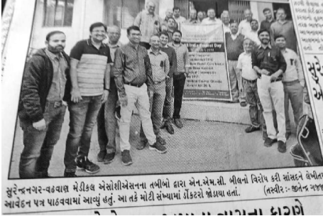
સુરેન્દ્રનગર-વડવાલ મેડીકલ એસોસિએશનના તબીબો દ્વારા એન.એમ.સી. બિલનો વિરોધ કરી સાંસદને બેબીબોમાં આવેદન પત્ર પાઠવવામાં આવ્યું હતું. આ તકે મોટી સંખ્યામાં ડોક્ટરો જોડાયા હતાં.