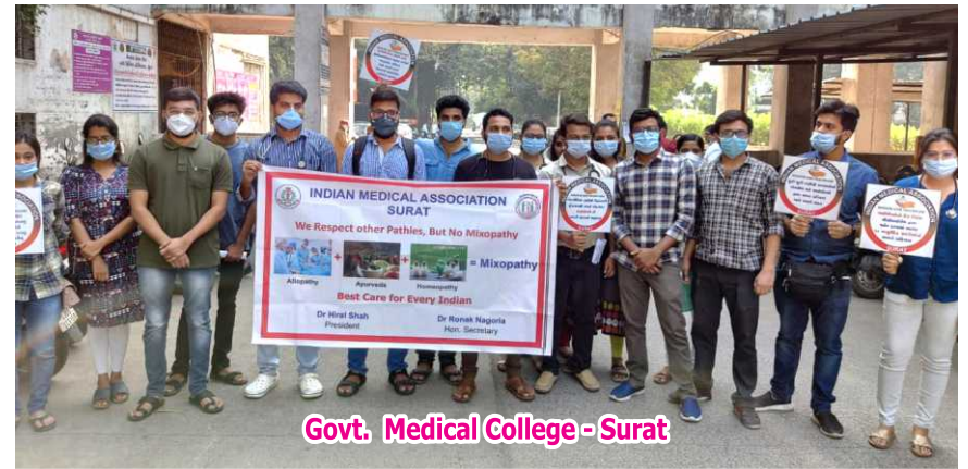
Govt. Medical College - Surat