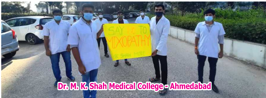
Dr. M. K. Shah Medical College - Ahmedabad