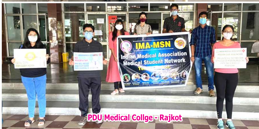
PDU Medical College - Rajkot