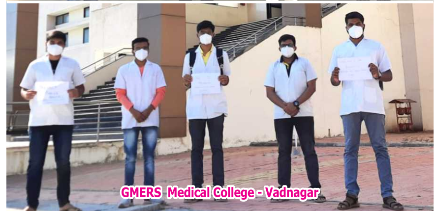
GMERS Medical College - Vadnagar