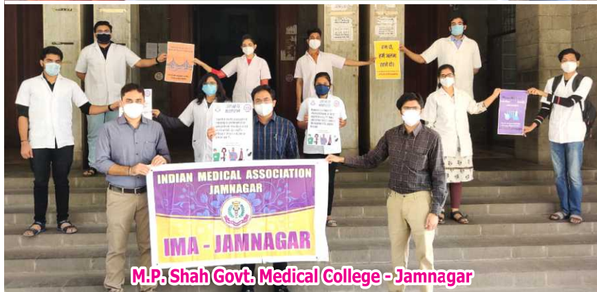
M.P. Shah Govt. Medical College - Jamnagar