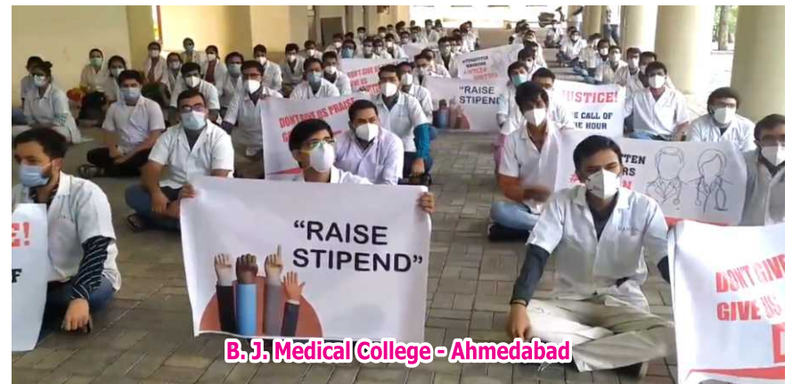
B.J. Medical College - Ahmedabad