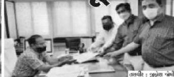
તસ્વીર : જુહાપુર ખેતી