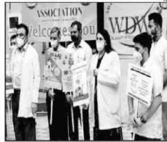
UP IN ARMS: The intern doctors said if the government does not announce an increase in their stipend by December 14, they will assume they have been relieved from their duties

Ahmedabad: Intern doctors on Covid duty at government hospitals since April have threatened to go on strike if their monthly stipend is not increased from the present Rs 12,800 per month to Rs 30,000.