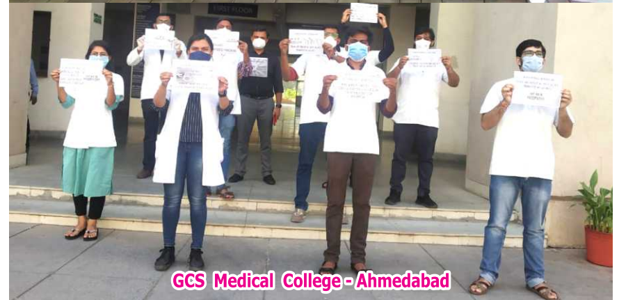
GCS Medical College - Ahmedabad