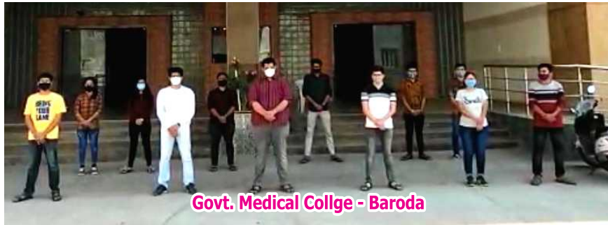
Govt. Medical Collge - Baroda