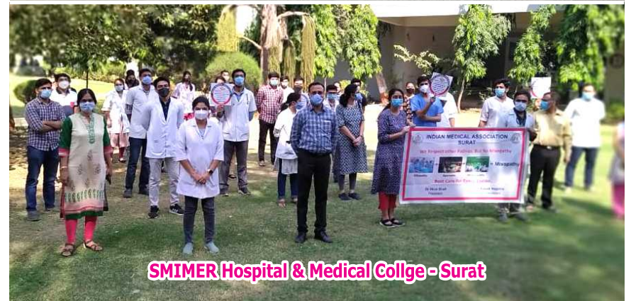
SMIMER Hospital & Medical College - Surat