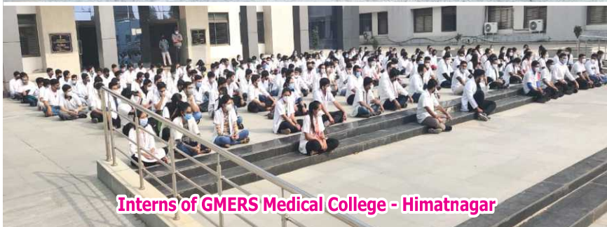
Interns of GMERS Medical College - Himatnagar