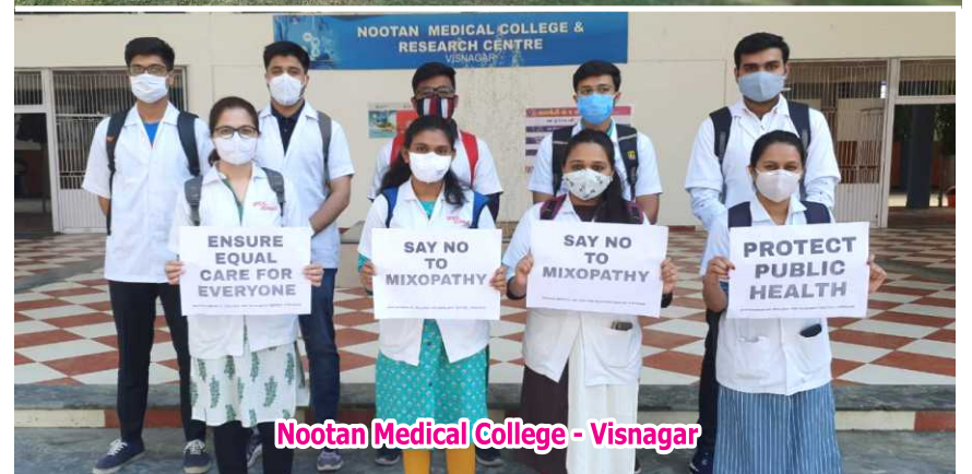
Nootan Medical College - Visnagar