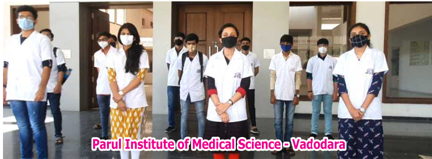
Parul Institute of Medical Science - Vadodara