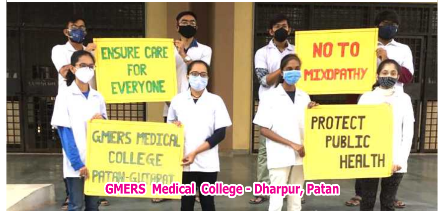
GMERS Medical College - Dharpur, Patan