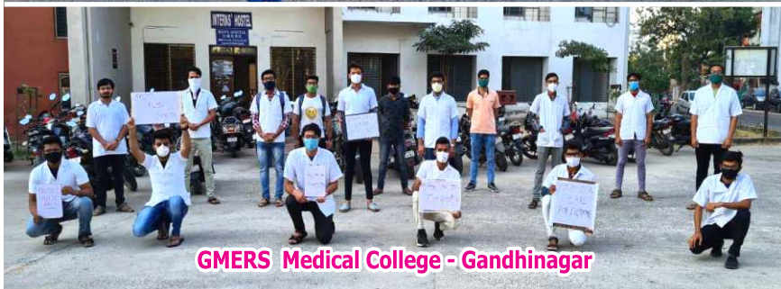
GMERS Medical College - Gandhinagar