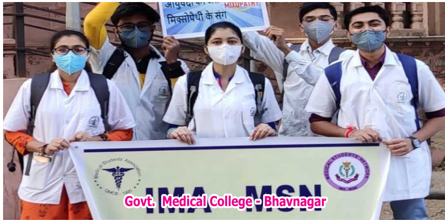
Govt. Medical College - Bhavnagar