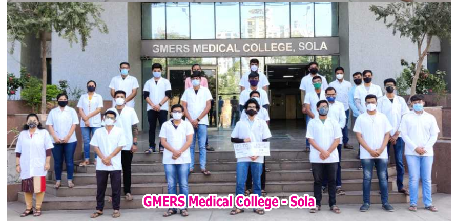
GMERS Medical College - Sola