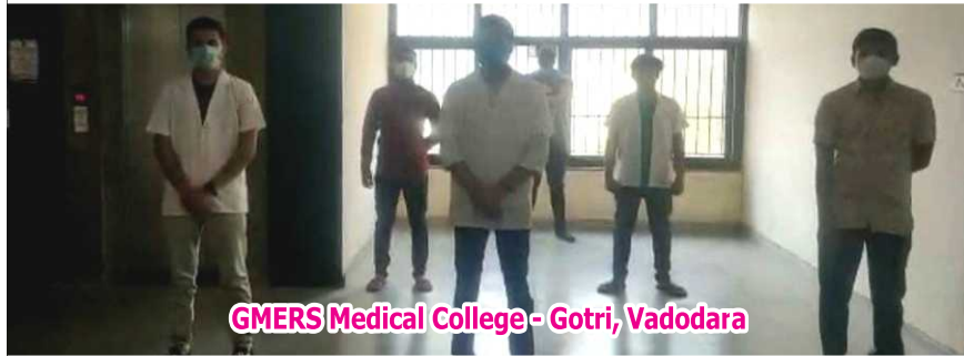
GMERS Medical College - Gotri, Vadodara