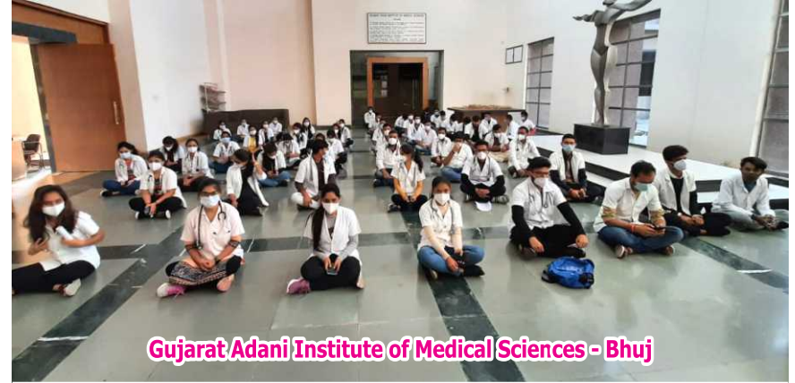
Gujarat Adani Institute of Medical Sciences - Bhuj