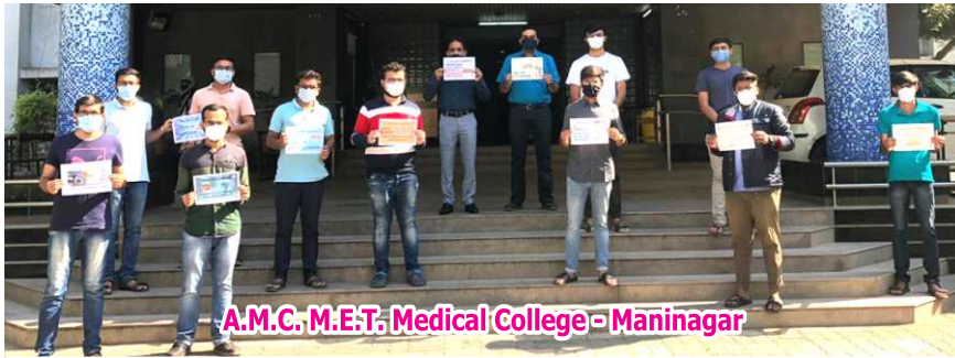
A.M.C. M.E.T. Medical College - Maninagar