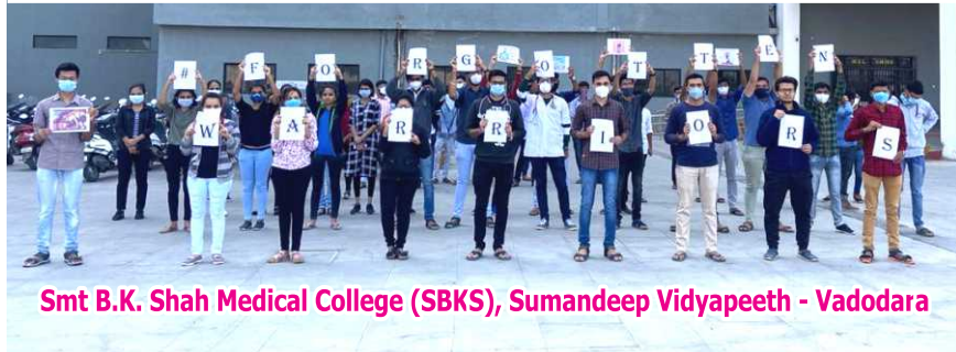
Smt B.K. Shah Medical College (SBKS), Sumandeep Vidyapeeth - Vadodara