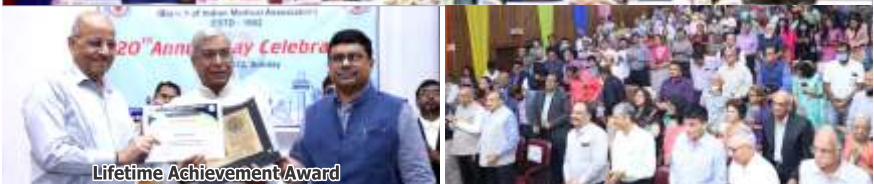
Lifetime Achievement Award