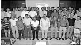
આરબી દેસાઇએડોલી ખાનગી હોસ્પિટલના ડોક્ટર્સની હડતાળને કારણે શહેરમાં 2000 સર્જરી રદ થઈ ગઈ છે.

વડોદરાના આરબી દેસાઇએડોલી ખાનગી હોસ્પિટલમાં ડોક્ટર્સની હડતાળને કારણે શહેરમાં 2000 સર્જરી રદ થઈ ગઈ છે. આરબી દેસાઇએડોલી ખાનગી હોસ્પિટલના ડોક્ટર્સની હડતાળને કારણે શહેરમાં 2000 સર્જરી રદ થઈ ગઈ છે. આરબી દેસાઇએડોલી ખાનગી હોસ્પિટલના ડોક્ટર્સની હડતાળને કારણે શહેરમાં 2000 સર્જરી રદ થઈ ગઈ છે.