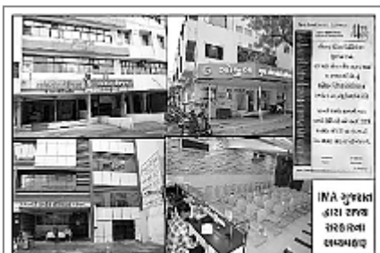
વિદ્યમા સભે રાજ્ય હડતાલ પડી છે. ઈન્ડિયન એસોસિએશન ઓફ મેડિકલ પ્રોફેશનલ્સ ટુડે ડે. ઈન્ડિયન મેડિકલ એસોસિએશન સુકાગા વાલ્ટી નગરે પડે છે.

જો હવે ICAI ગ્રાઉન્ડ ફ્લોર પર આવે તો ઓપરેશન થિયેટર પણ નીચે લાવવા પડે.